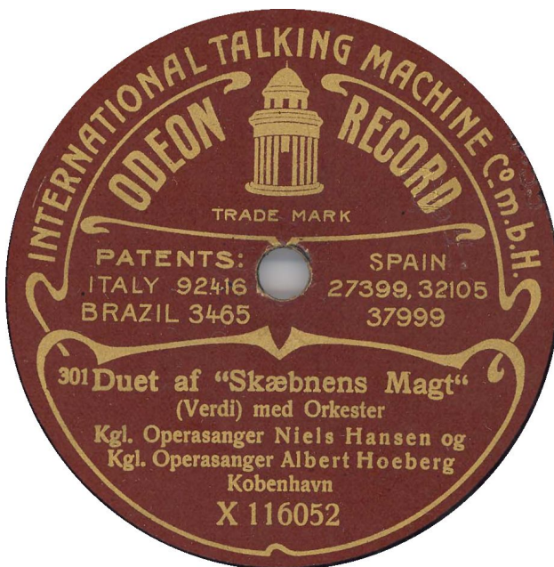
Prøveplade af Kp 53 – "Bestillingsnummer 301"