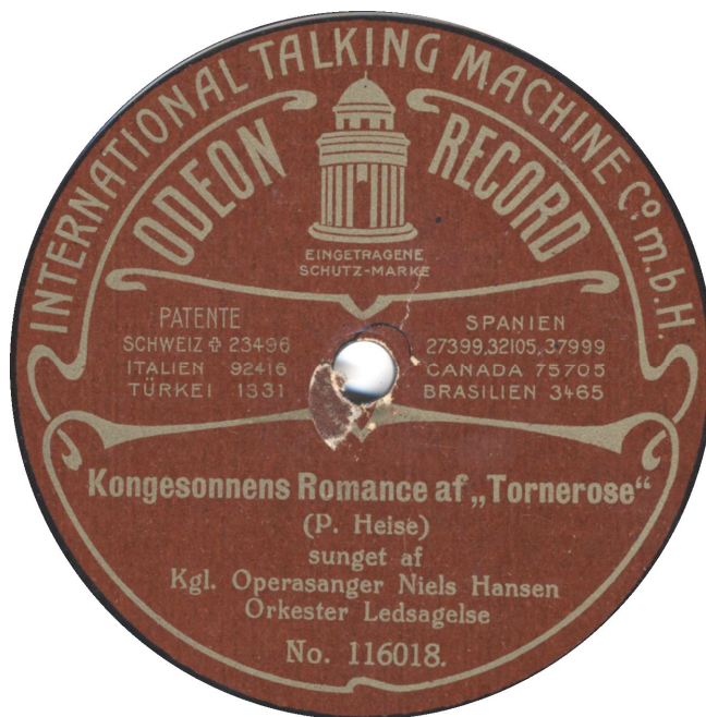
En tidlig og senere etiket. Med og uden X-prefix. Begge plader har ”sikkerheds-rille”.