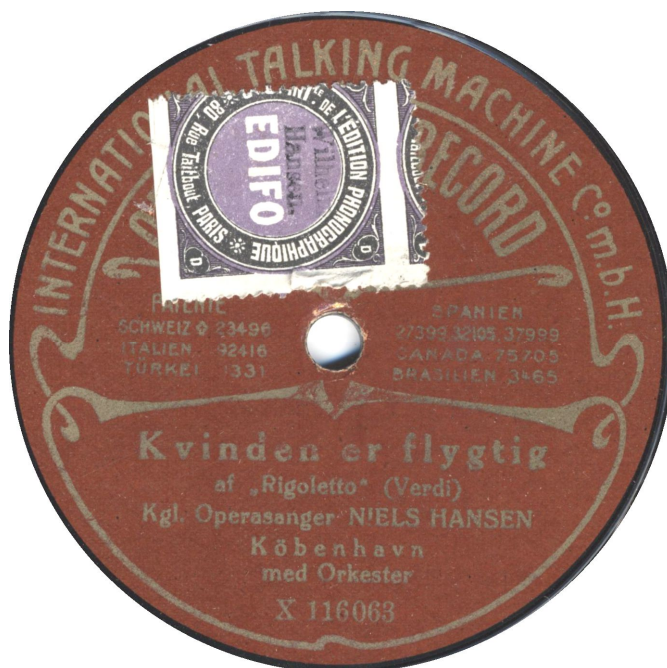
Fransk rettighesmærke stemplet med Wilhelm Hansen