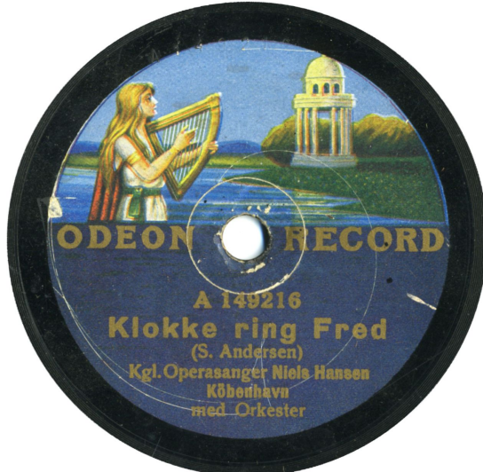
Etiketten er beskåret på grund af varigheden af den indspillede sang (ca. 3.20)