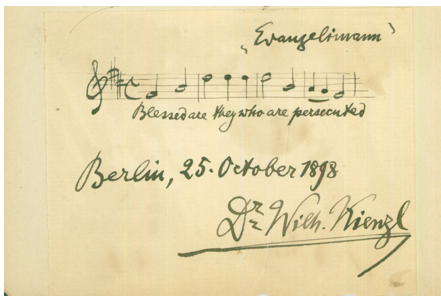
En musikalsk hilsen fra komponisten Dr. Wilh. Kienzl