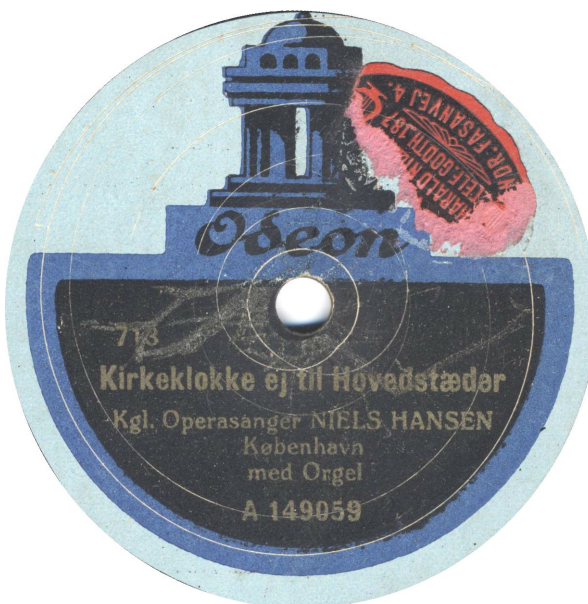
Bagsideetiketten til den blå er af lyre-typen