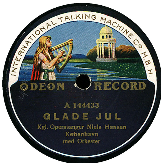
Uden punktum efter "A" for pladenummeret koblet med 466