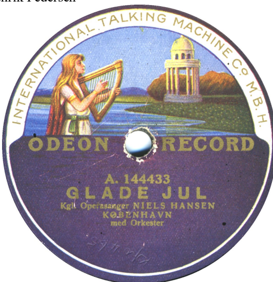
Koblet med Kpo 466-2