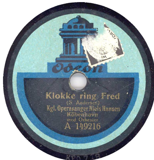
Også "lille" etiket, men med grå extra kant.