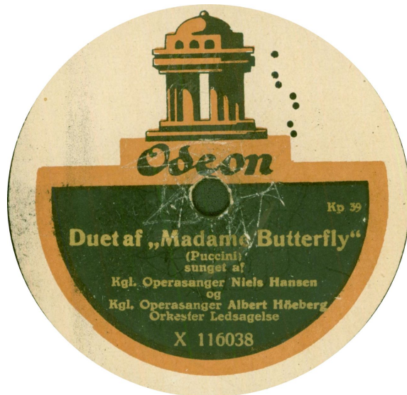
Kp 39-2 koblet med Kp 40