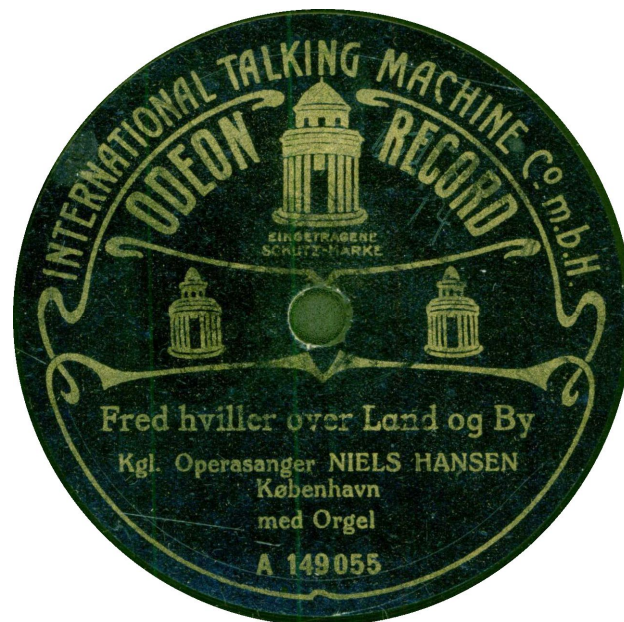
En sjældent set etiket med Niels Hansen