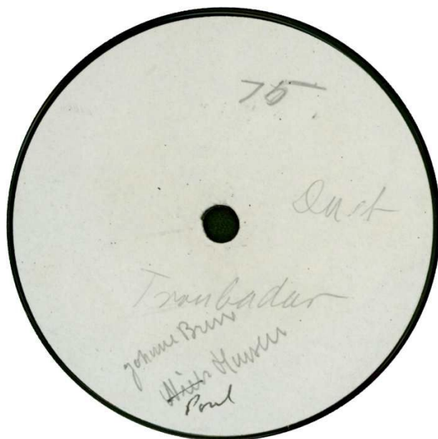
Prøveplade 116 008