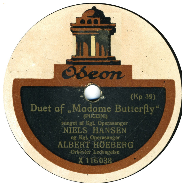
Kp 39-2 begge koblet med Kp 40