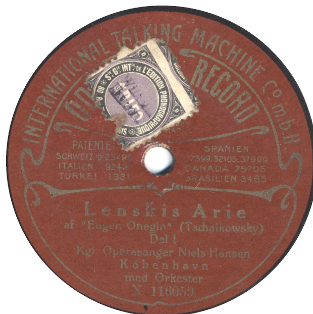
Fransk rettighesmærke stemplet med Wilhelm Hansen