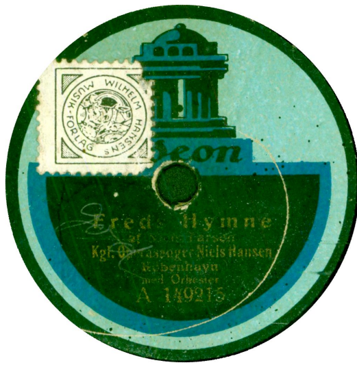
Også med "lille" etiket.- th. lille etiket og grå ring omkring den