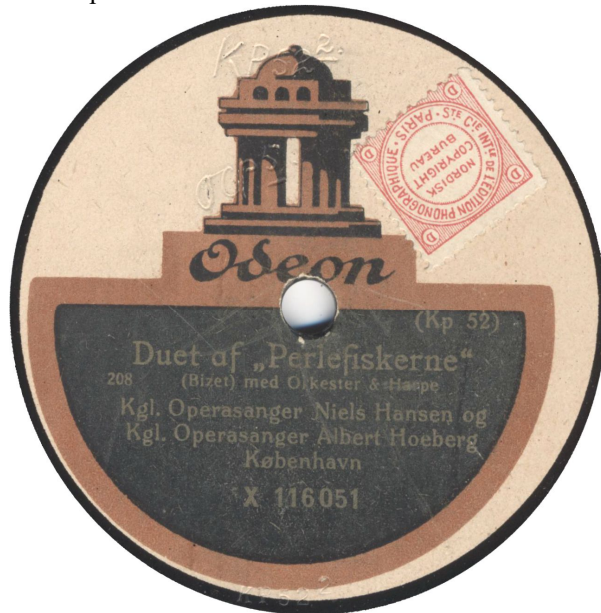
Kp 52-2 koblet med Kp 53-2. Påsat en NCB mærkat. Begge har "Bestillingsnummer 208"