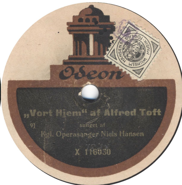
Uden og med X-prefix – ”Bestillingsnummer 9” – uden matricenr.