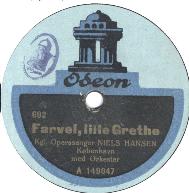
Th: Med Odeon stempel og bestillingsnummer. Den anden side har ikke bestillingsnummer (Kpo 655)