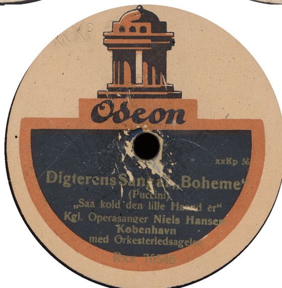
Tre forskellige layouts