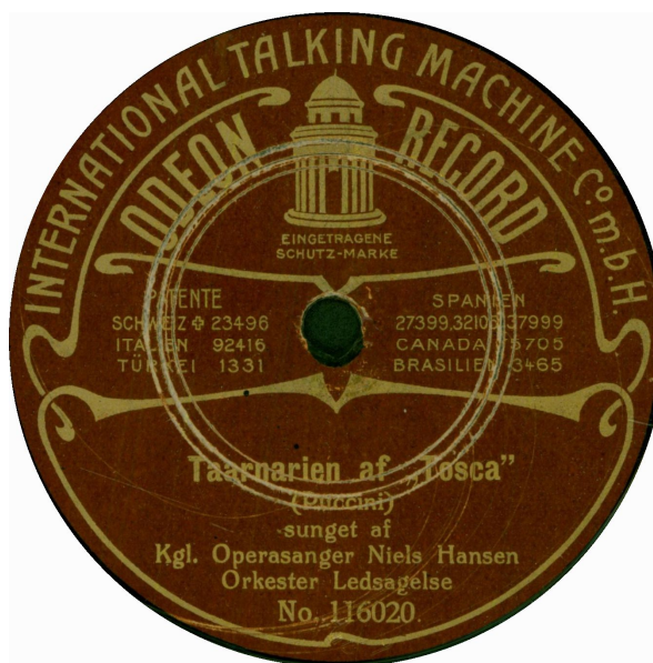
Begge koblet med Kpo 27