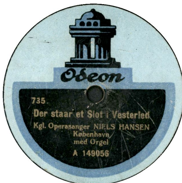
nyt lay-out og med bestillingsnr. 735