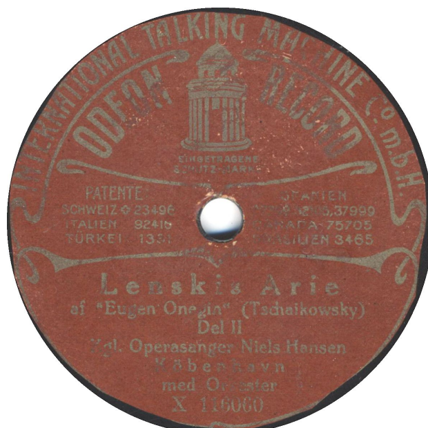
Etiketten er beskåret pga længden på arien Ifølge Lindstrømkoncernens fortegnelser, så er Kp 65 og 66 optaget i 1923!? Det er næppe rigtigt.