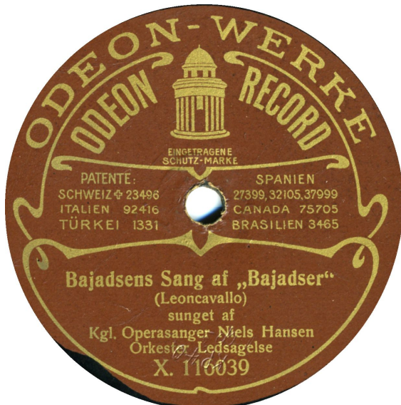
Odeon-Werke Koblet med Kpo 27