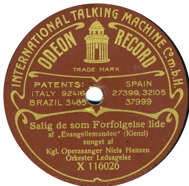
Koblet med Kpo 40