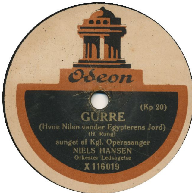
Uden bestillingsnummer og med "Hvor..." men med matricenr.