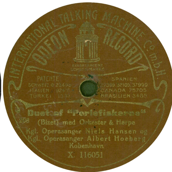
Kp 52-2 koblet med Kp 53-2