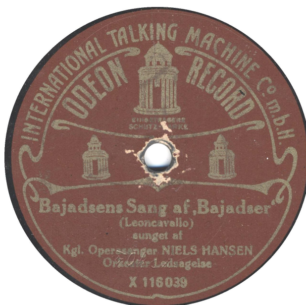
Odeon-Werke - Etiket med og uden patenter – International Talking Machine