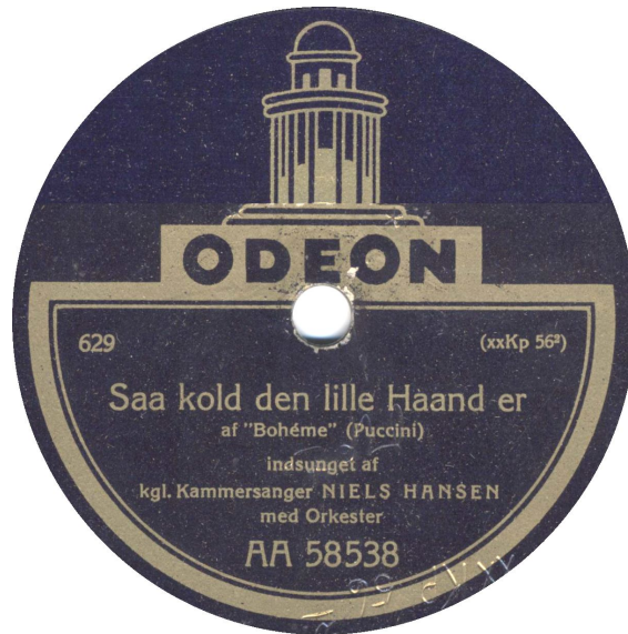
Nu med bestillingsnummer 629