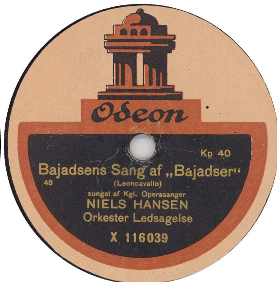
Koblet med Kpo 39-2 – De tre sidste etiketter med ”Bestillingsnummer 08”