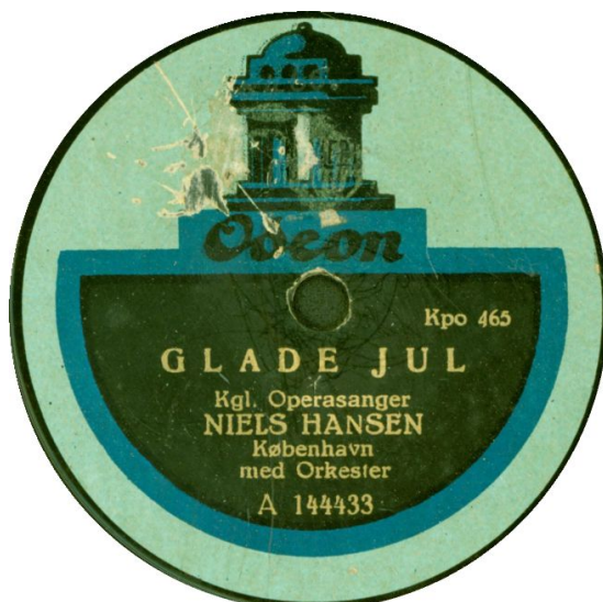
Koblet med Kpo 466