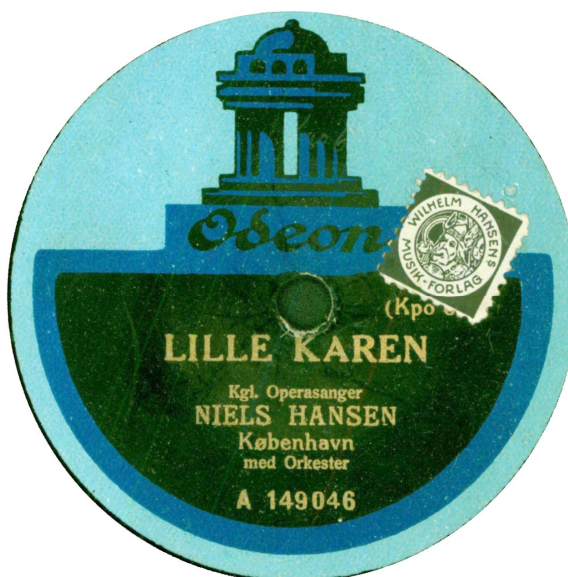
Med fransk rettigheds-sticker og (begge) koblet med en helt gammel etiket (Kpo 656)