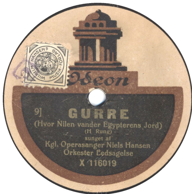
Hvad mon 9] står for? Formentlig bestillingsnummer? Se senere. Uden matricenr.