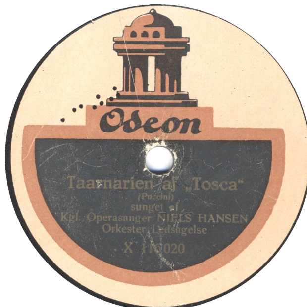
Koblet med Kpo 27