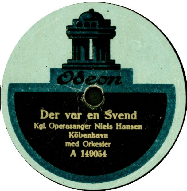
Scan tv Erik Høst