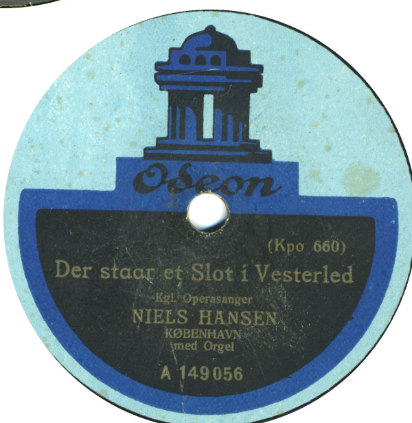
De blå etiketter har nu matricenummer påført – små lay-out forskelligheder