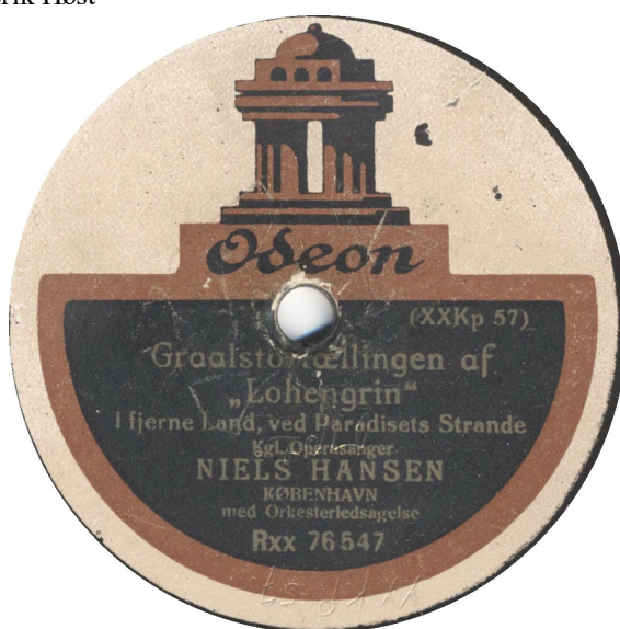
To forskellige layouts