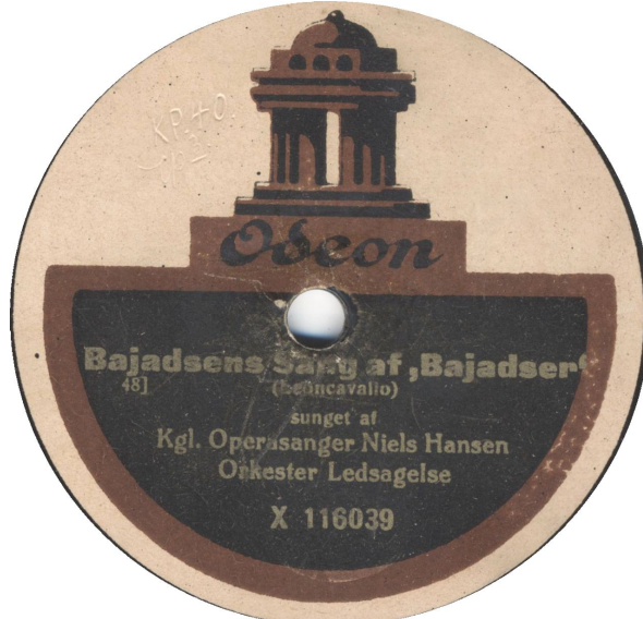
Koblet med Kpo 39-2