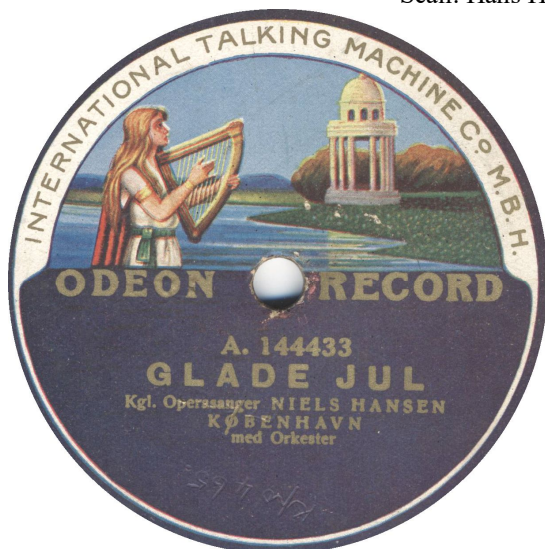
Koblet med Kpo 466