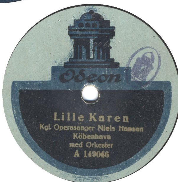
Th: Med Odeon stempel og uden bestillingsnummer. Den anden side har bestillingsnummer 692 (Kpo 656)