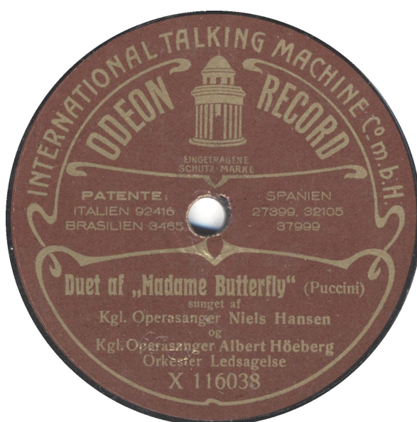
Koblet med Kpo 40-2. Uden og med patenter (færre end før).