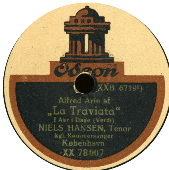
Fejlagtigt listet som: Alfreds Arie – I Aar i Dage – Se 81.