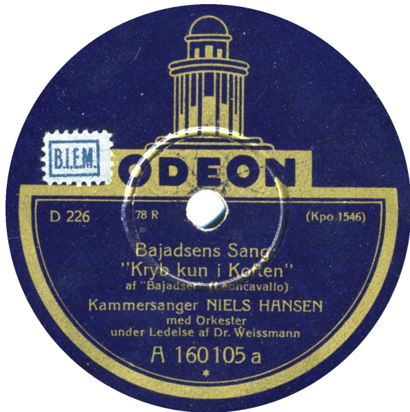
Uden og med BIEM sticker (beregnet for England?)