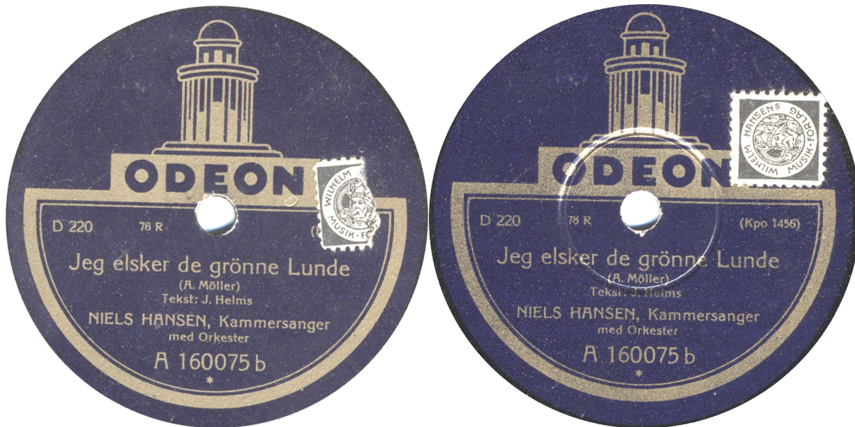
To typer presning. Uden og med hævet center