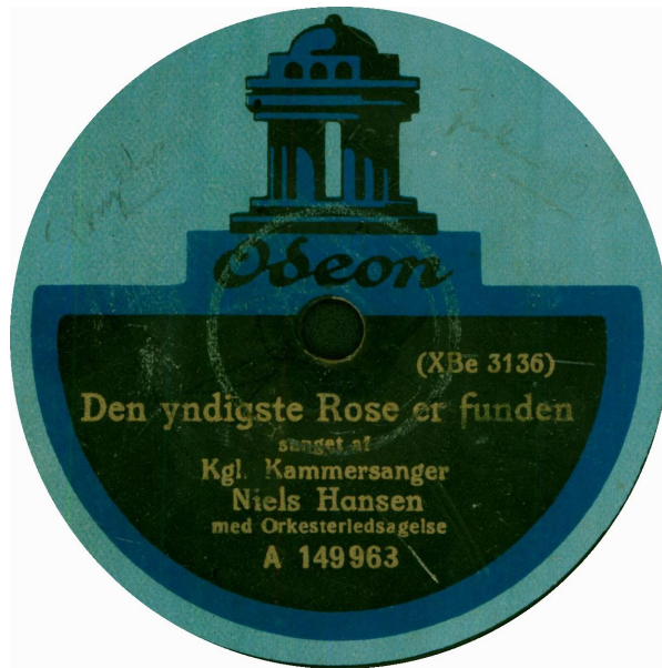
koblet med xBe 3141