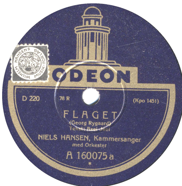
To typer presning. Uden og med hævet center

161. 1928.06.26 Kpo 1452 Jeg vil elske mit Land Alfred Toft Orkester – Kapellmester Weigert – Optaget i Berlin