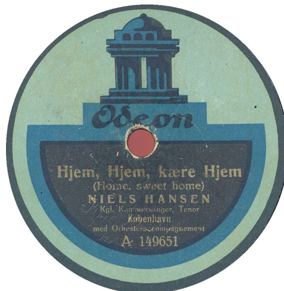
med grå extra kant