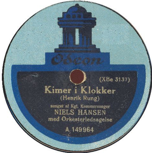
koblet med xBe3143