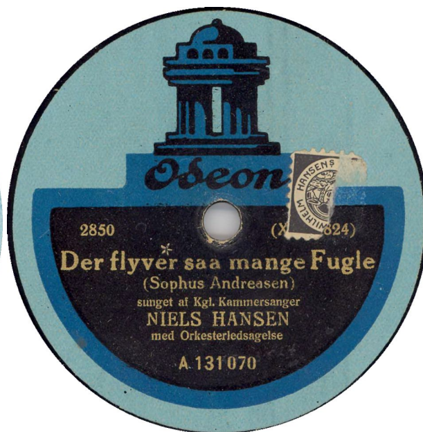
Med og uden bestillingsnummer 2850.