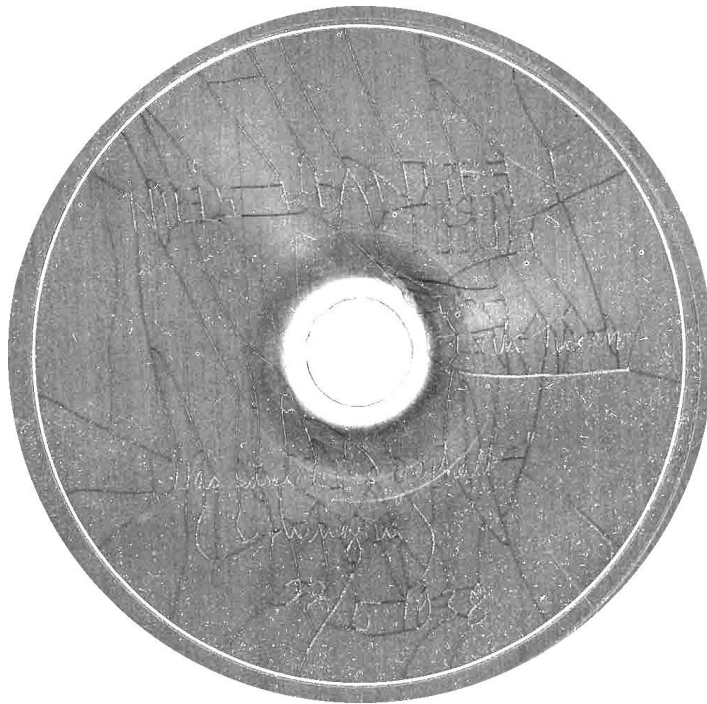
En hjemmelavet optagelse fra radioen. Det er svært at se teksten.